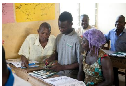
Gauche: FBS en action Enthousiasme Droite : Utilisation de la calculatrice